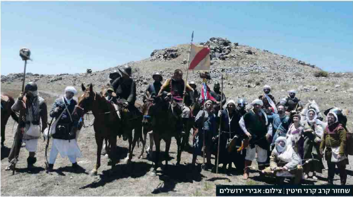
שחזור קרב קרני חיטין

זו משמעות השחזור ההיסטורי. המטרה היא להקים לתחייה את האירוע, שעה אחר שעה, קילומטר אחר קילומטר, קרב אחר קרב, מילה אחר מילה. לדרמה הזו ותוצאותיה עוצמה גדולה ביותר. היא נהווית יום אחרי יום על ידי כל אותם אנשים שהיו שם, ובקרב הערבים בגליל היא בעלת משמעות עד היום".