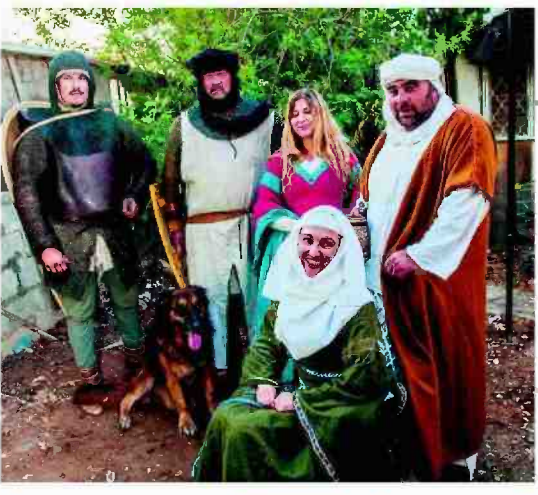
אביר ירושלמי בדרך לקרב. (משמאל למעלה: אבירים באימונים השבוע | למטה: בשחזור קרב קרני חיטין)