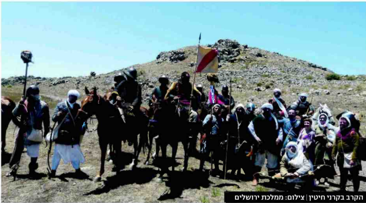
הקרב בקרני חיטין

זו משמעות השחזור ההיסטורי. המטרה היא להקים לתחייה את האירוע, שעה אחר שעה, קילומטר אחר קילומטר, קרב אחר קרב, מילה אחר מילה. לדרמה הזו ותוצאותיה עוצמה גדולה ביותר. היא נחווית יום אחרי יום על ידי כל אותם אנשים שהיו שם, ובקרב הערבים בגליל היא בעלת משמעות עד היום.