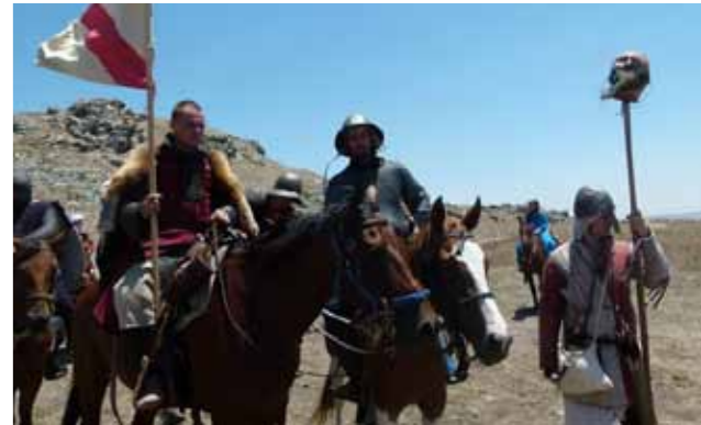
צילומים ממסע חיטין בשנים קודמות. בשטח מרגישים את השמש, הסלעים והקוצים כמו רגליך